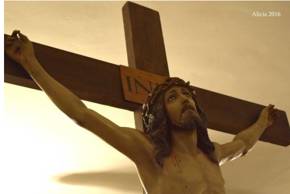
Imagen en pasta – madera y clase fina con cruz de madera. Sus pies se encuentran sujetos por un solo clavo semejante a los de las manos. En el letrero aparece el INRI (iniciales de las palabras del título en latín: Iesus Nazarenus Rex Iudeorum).